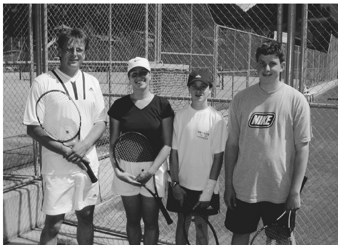
Aus der TennisZytig Nr. 24, 2003