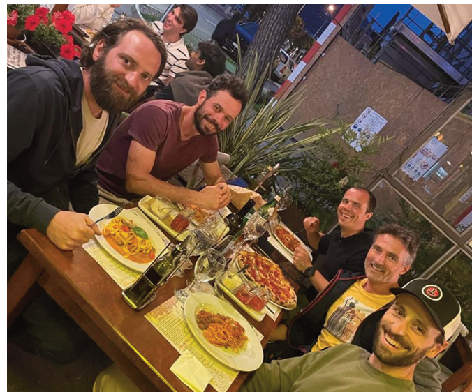
Die IC-Mannschaft im Tessin